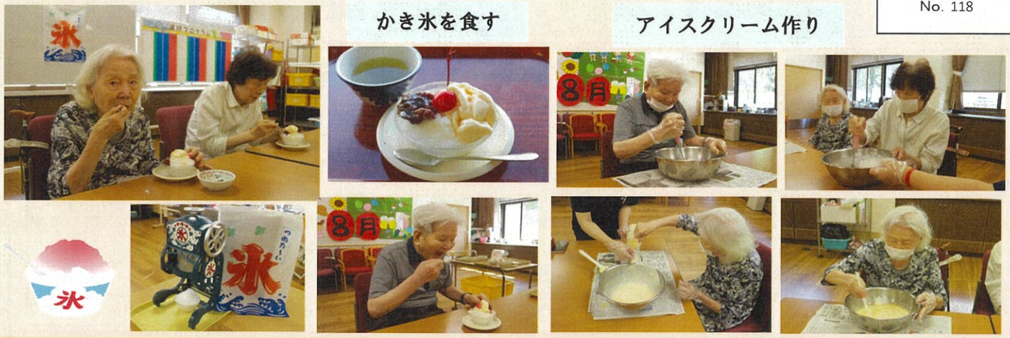
アイスクリーム作り